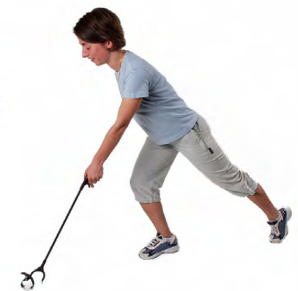
GREIFZANGE IN AKTION

Diese Hilfsmittel erhalten Sie während Ihres Aufenthalts, falls noch nicht vorhanden, auch bei uns in der Klinik.