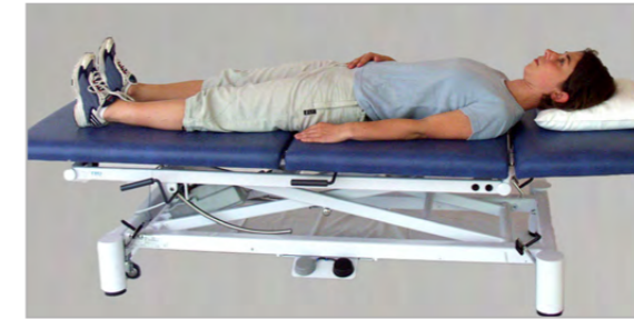
LIEGEPOSITIONEN NACH DER OPERATION